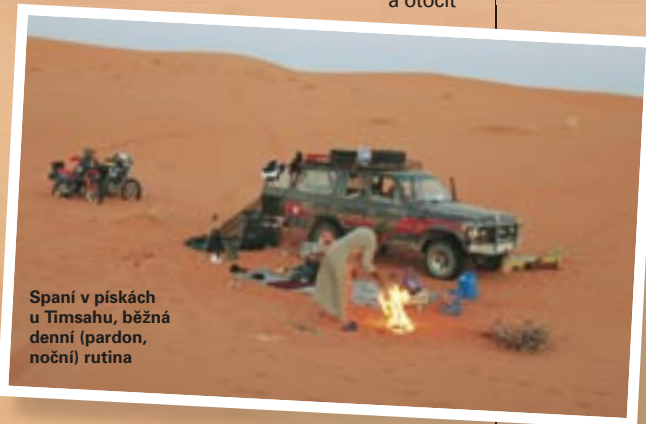
Spaní v pískách u Timsahu, běžná denní (pardon, noční) rutina

hrbolku, ve kterém mají díry šakali. Během odpoledne je žár šílený, je zataženo, dusno a zběsile otravují mouchy (nechápu, kde se tady vzaly). Voda z lahví je tak horká, že nejde pít, zip od moskytiéry páli do nohy, obtížně se dýchá, jakýkoliv pohyb okamžitě vysiluje. Nad námi občas zakrouží krkavci.... Teplota ve stínu dosahuje neuvěřitelných 60 °C!! Po 6. hodině teplota klesá pod 50 °C, a tak zkusíme kus jet. Daří se nám 40 km. Cesta vede už nepřetržitě ve vysokých dunami. Husajn jednou zahrabe auto, Sqwer i já několikrát motorku před hranou duny. Sqwer mi párkrát pomáhá vyhrabat a otočit