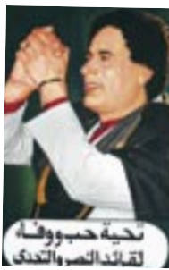
Za naši návštěvu nám srdečně poděkoval i libyjský boss Muamar Kadáfí

Waw En Namus kráter je bomba. Popsat se nedá, musí se vidět. Sjíždíme se Sqwerem po černé lávové stusce na dno k jezeru, odkud se zvedá střední sopouch s dalším kráterem. Sqwer neodolává výzvě a podniká výjezd na vrcholek sopouchu. Šílenec... Nahoře je z něj malinký mravenec. Zato dolů si to vychutnává s jedním pádem a na středové plošince chvíli nešťastně hledá kudy dál. Převýšení bylo asi 300 m, strmá sopečná stěna. Nejbližší nemocnice je tři dny cesty... Pak ještě kráter obijíme dokola. Cesta zpět je peklo, ve stínu 45 °C a silný horký poryvový vítr. Pro změnu v největším žáru opět prorazím přední duši – tu s tou modrou břečkou, co jsme včera zalepili. Ten sajrajt je úplně všude, už to nechci v duších ani vidět. Sulejman mě uklidňuje historií, že jednou Němcům mezi Ghadamesi a Ghatem klekl motor u Yamahy, tak ji celou rozebrali a naložili na auto. Odpolední ležení pod stromem připomíná saunu se silným ventilátorem. A pak zlatý hřeb večera – mám opět prázdný předek. Asi tři-