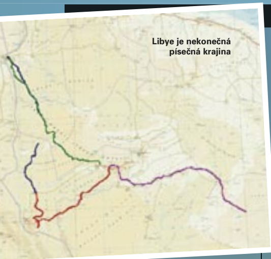
Libye je nekonečná písečná krajina

Proč jsme se vydali do Libye, to už jsme si probrali minule. Teď se víc vrhneme na jednotlivá dobrodružství, ať si to s námi taky trochu prožijete.